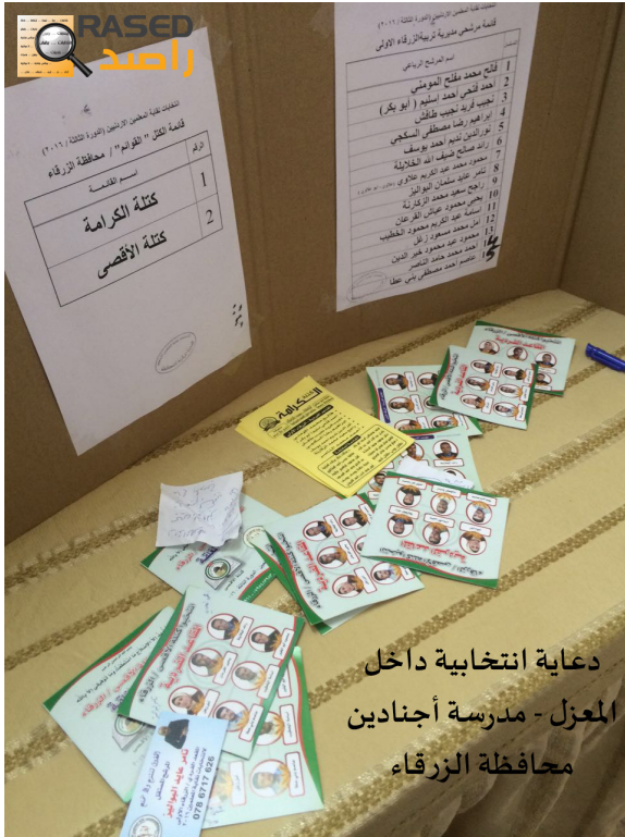
دعاية انتخابية داخل المعزل - مدرسة أجنادين محافظة الزرقاء