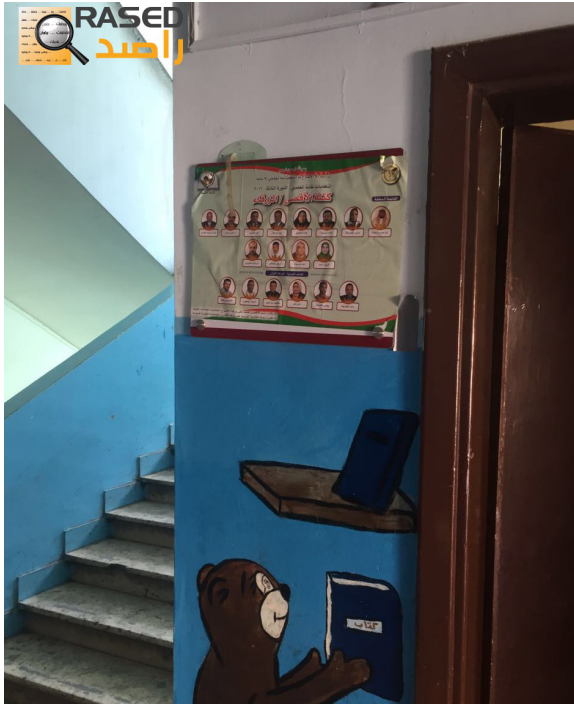
عايات انتخابية - مدرسة مؤته الاساسية المختلطة - مديرية الزرقاء الاولى - الزرقاء