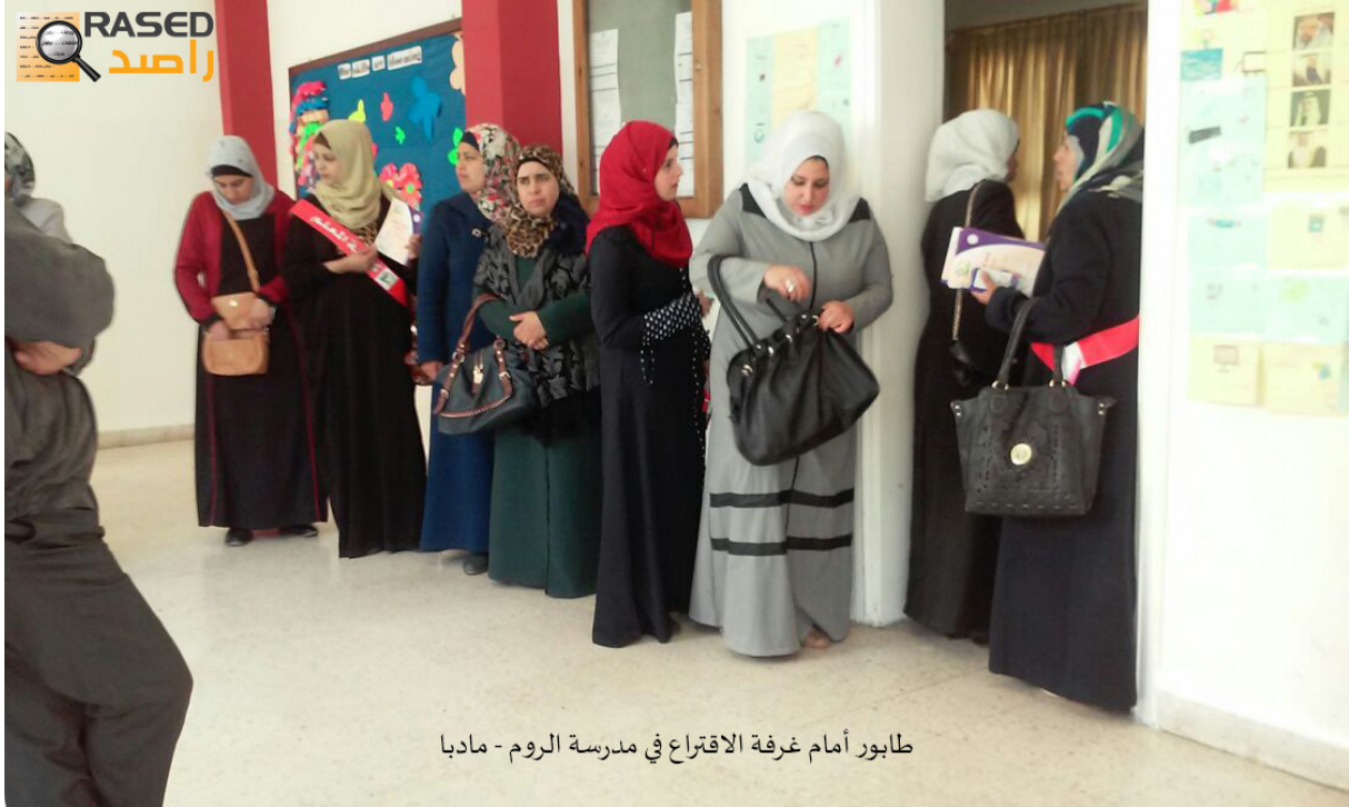
طابور أمام غرفة الاقتراع في مدرسة الروم - مادبا